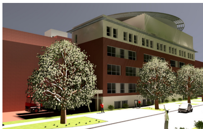
SO SOLL ER EINMAL AUSSEHEN, DER „ANBAU WEST“ NACH FERTIGSTELLUNG ANFANG 2017

Knapp sieben Monate nach der offiziellen Grundsteinlegung wurde am 15. Dezember 2015 das Richtfest des „Anbau West“ gefeiert. Der Rohbau ist weitestgehend abgeschlossen und auch schon komplett eingerüstet für die Montage der Fenster.