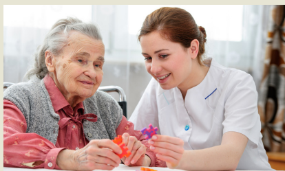
PATIENTEN MIT DEMENZ BENÖTIGEN VIEL AUFMERSAMKEIT UND ANREGUNGEN

Laut einer Studie weisen rund 12 Prozent der älteren Patienten in der Neurologie die Nebendiagnose Demenz auf. Diese Tatsache und die Erfahrungen aus einem Jahr Geriatrischer Komplexbehandlung im KK Bottrop haben gezeigt, dass Demenzpatienten eine besondere Form der Betreuung, Wertschätzung und Aktivierung benötigen. Diese Aufgabe können die Pflegekräfte alleine so nicht stemmen. Zur Entlastung werden daher zukünftig qualifizierte Demenzbetreuer eingesetzt, die eine sechsmonatige Fachausbildung im Hause durchlaufen haben. Im November hat zum ersten Mal eine Ausbildungsgruppe den Vollzeitlehrgang in Kooperation mit der GAFÖG gestartet.