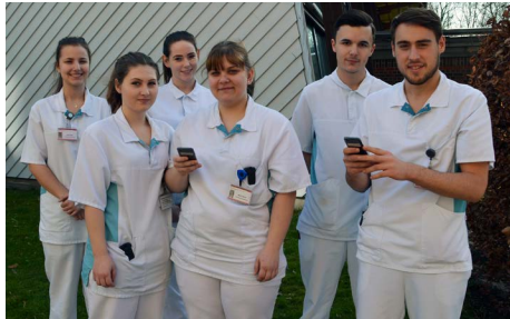
DER BEGLEITEDIENST NUTZT DIE VORTEILE MODERNSTER TECHNIK FÜR DIE KOORDINATION IHRER AUFGABEN

Wenn Sie auf den Gängen junge Mitarbeiter und Mitarbeiterinnen mit vermeintlichen Smartphones in den Händen sehen, könnte schnell ein falscher Eindruck entstehen. Diese Kollegen spielen nicht etwa an ihren Handys, sondern nutzen die mobilen Geräte für ihre Arbeit als Begleitedienst. In Ausübung ihres Freiwilligen Sozialen Jahres oder Bundesfreiwilligendienstes in unserem Hause erhalten und koordinieren sie mit dieser moderne Technologie Aufträge zum Begleiten der Patienten z. B. auf dem Weg vom Patientenzimmer zu Untersuchungen bzw. Behandlungen und zurück. Dadurch werden Stationen und Leitstellen erheblich entlastet, denn der Begleitedienst sorgt innerhalb kürzester Zeit für eine strukturierte und schnelle Beförderung von Patienten.