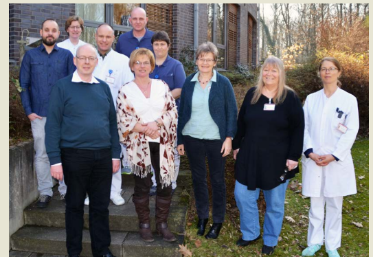
MITARBEITER DER FACHBEREICHE ANÄSTHESIE, NEUROLOGIE, INNERE MEDIZIN, SOZIALDIENST, SEELSORGE UND PHYSIOTHERAPIE BILDEN DAS INTERDISZIPLINÄRE TEAM FÜR DIE PALLIATIVBEHANDLUNG