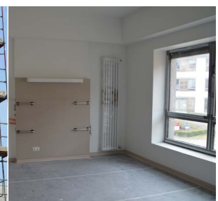
ANBAU WEST: DIE ERSTEN PATIENTENZIMMER SIND BALD BEZUGSFERTIG