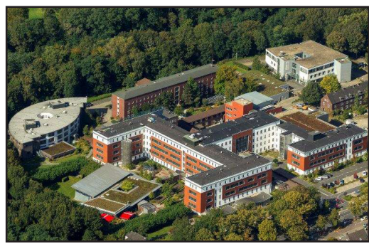
Knappschaftskrankenhaus Bottrop Patientenzeitung