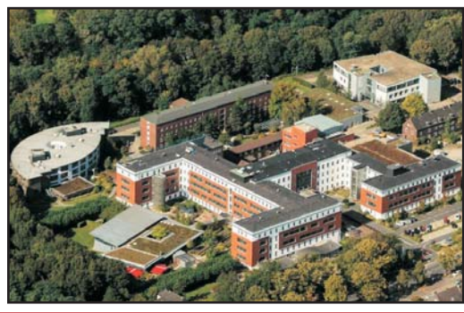
Knappschaftskrankenhaus Bottrop Patientenzeitung