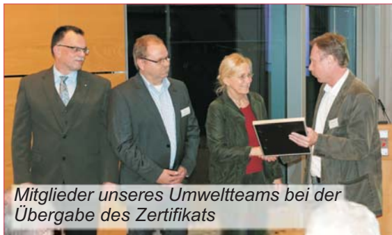
Mitglieder unseres Umweltteams bei der Übergabe des Zertifikats