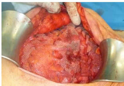
Abb. 7: Polypropylen-Mesh (20x10cm) in Onlay-Technik