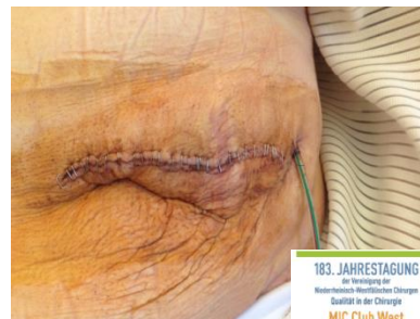
Abb. 8: Wundverschluss Post-OP