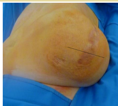
Abb. 2: Narbenhernie nach Nephrektomie / Prä-OP