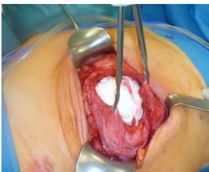
Abb. 5: Bruchlücke circa 5 x 5 cm