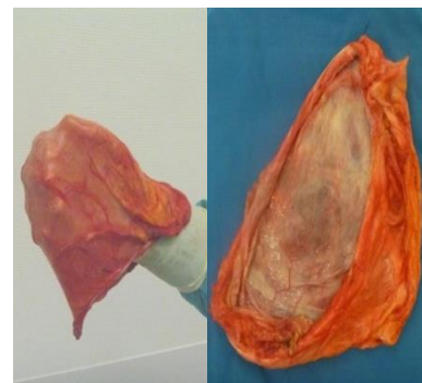
Abb. 4: Bruchsack nach Resektion