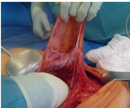
Abb. 3: Präparation des Bruchsackes