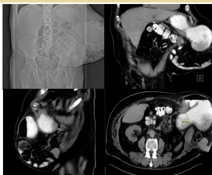
Abb. 1: Abdomen CT – Inkarzerierte Narbenhernie

Die konventionelle Bauchdeckenrekonstruktion mittels Onlay-Hernioplastik kann in besonderen Fällen ein adäquates Verfahren zur Behandlung großer Narbenhernien darstellen.