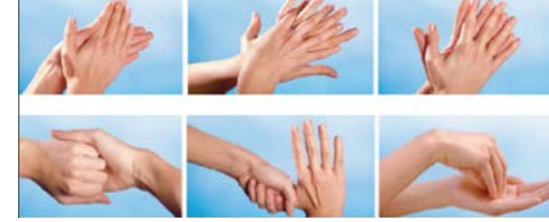
Ellerin dezenfekte edilmesi

uygulayınız ve bu uygulamayı yaparken parmak uçlarını, parmak aralarını ve başparmaklarınızı unutmayınız.